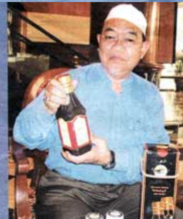
Berdoa dan berikhtiarlah dengan Kacip Emas. Keunggulan herba terbukti zaman berzaman.

Mingguan Warta Perdana - 9 Disember 2007