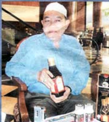
Saya penghidap diabetes... saya berubah dengan Kacip Emas.

Justeru itu katanya rumusan herba yang terdapat dalam jenama penawar Kacip Emas dengan sendirinya menjadikan produk itu ( Kacip Emas ) herkesan sebagai iktihar merawat bagi penghidap diabetes. Lihat muka 2